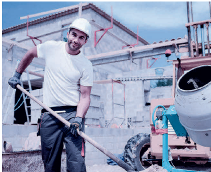
Zu den meldepflichtigen Berufsarten gehören neu alle Tätigkeiten für Hilfsarbeitskräfte, mit Ausnahme von Reinigungspersonal.

Liste der meldepflichtigen Berufsarten 2020: www.arbeit.swiss > Arbeitgeber > Stellenmeldepflicht