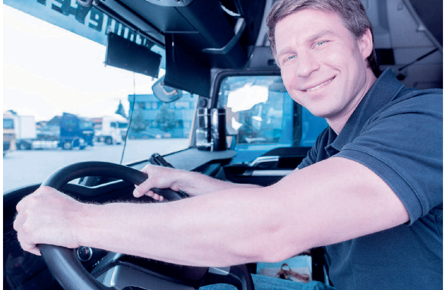
Fehler können passieren. Entscheidend ist, ob der Arbeitnehmer seiner Sorgfaltspflicht nachkommt.

In der Praxis werden mögliche Schäden meistens durch den Arbeitgeber versichert, insbesondere bei Fahrzeugen. Einige Gerichte sind der Meinung, dass hier eine Vollkaskoversicherung abgeschlossen werden müsse. Der Schaden, den der Arbeitgeber gegenüber dem Arbeitnehmer höchstens geltend machen kann, ist auf den Selbstbehalt, einen allfälligen Malus, ungedeckt gebliebene Schäden oder mögliche Regressforderungen beschränkt.